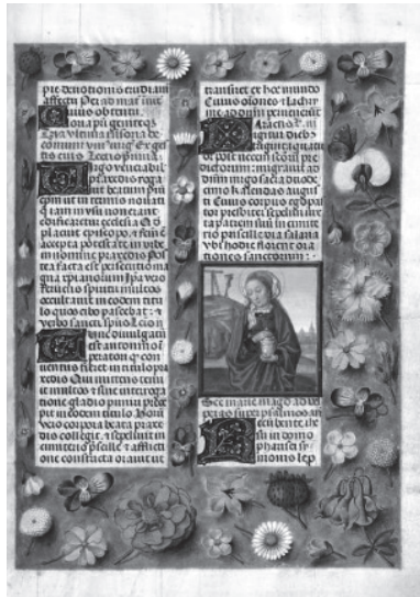
Fig. 1: Libro de horas de la Reina Isabel (British Library, Mss. 18851, f. 108r)